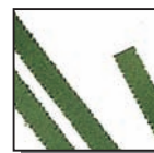
Coupe fibres 4 mm Niveau de sécurité DIN 2 Documents internes.